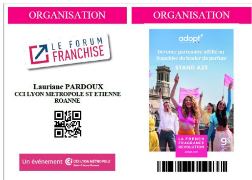
Logo sur badge