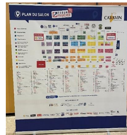
Affichage sur plan géant