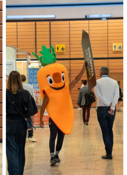
Présence de la mascotte de l'enseigne