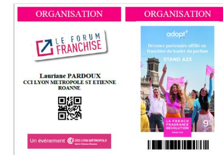
Logo sur badge