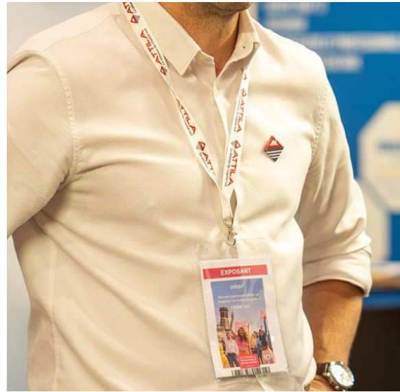
Tour de cou personnalisé