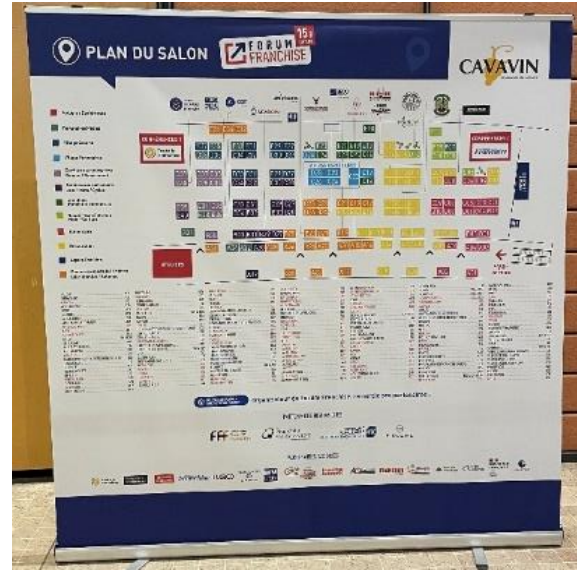
Affichage sur plan géant