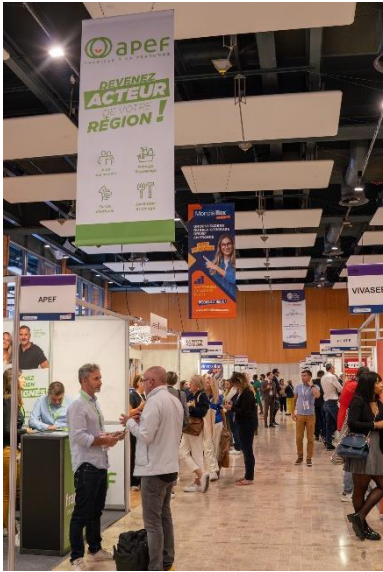
Affichage géant suspendu