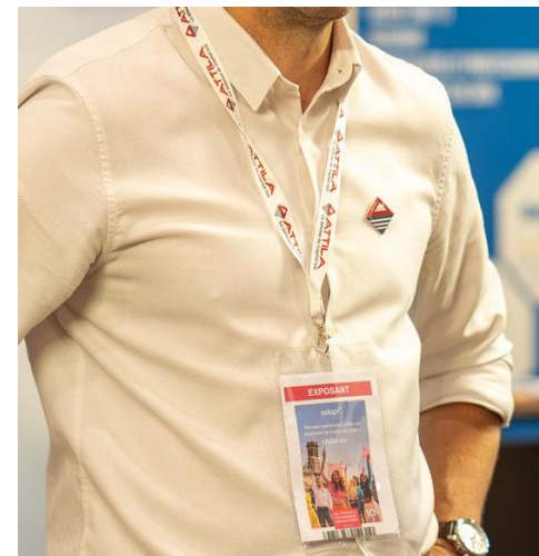
Tour de cou personnalisé